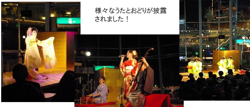
様々なうたとおどりが披露されました！