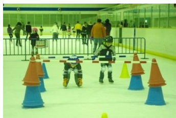
道具を使った本格的な練習です