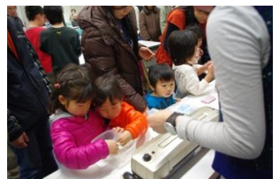
大人気のペンギンの羽毛カード作り！