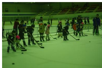
最終回はアイスホッケー体験！