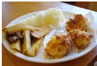
ペルーの回、 ココナッツのお菓子と 煮込み料理