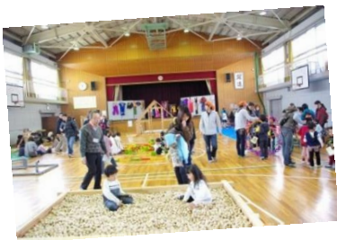
昨年の「世界の遊び」の様子 今回も様々な遊びを体験できます！

また、西築地小学校の体育館には世界の様々な遊びも登場！ たくさんの遊びの体験と探検を満喫できる一日、ご家族でご参加ください！