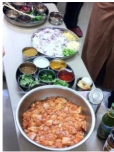
スリランカの回、 スパイスを使った本格カレー