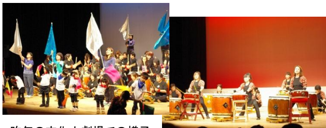
昨年の文化小劇場での様子 今回は会場が変わってよりパワーアップ！