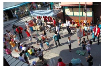
人気の玉入れを今年も開催！