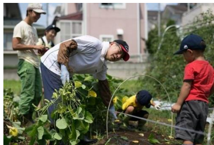
みんなの畑の様子