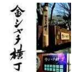
「金シャチ横丁」屋号