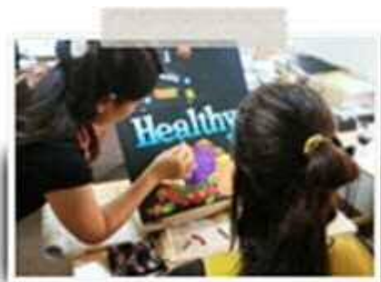
ワークショップも開催