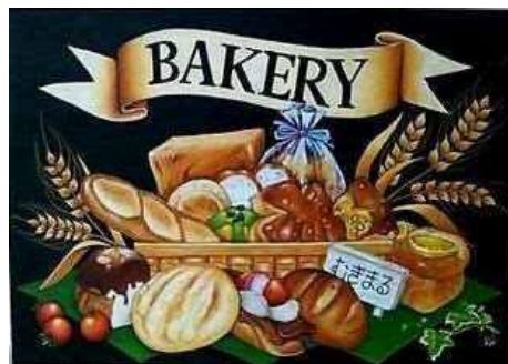
スターバックスコーヒーさまの チョークアートポスター