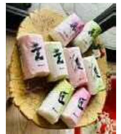
ヤマサちくわ株式会社 商品ロゴ