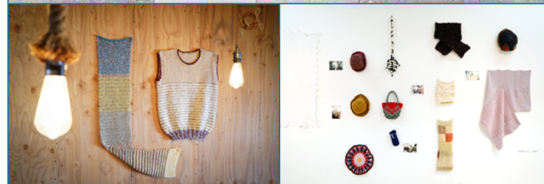
写真は昨年度の展示、活動の様子