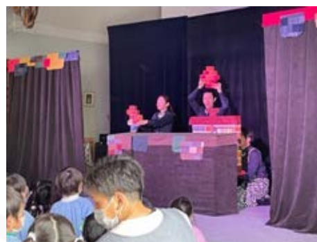
小鳩幼稚園での防災人形劇の様子