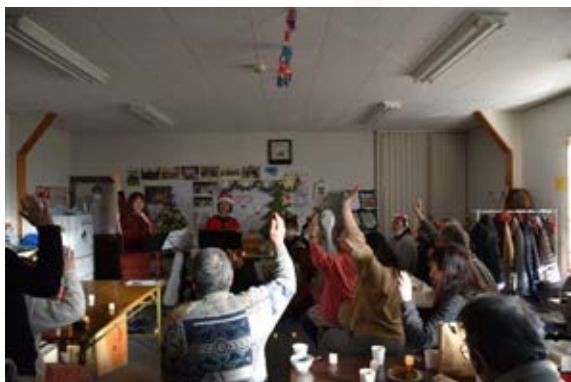
NPO すずめくらぶ、かもめくらぶ