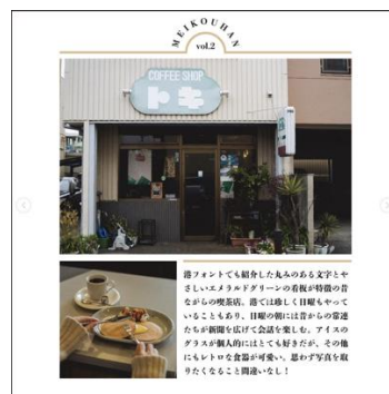
店舗紹介イメージ 2