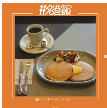
店舗紹介イメージ 1