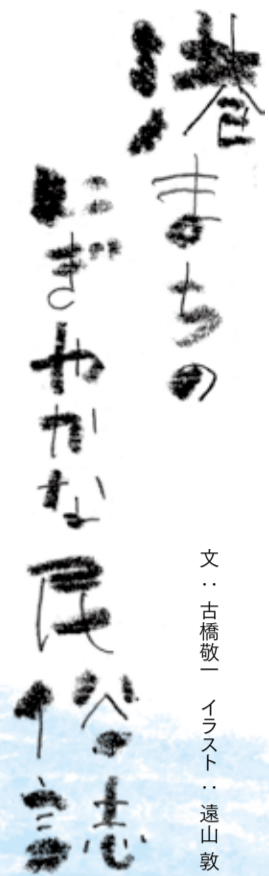
文：古橋敬一 イラスト：遠山敦